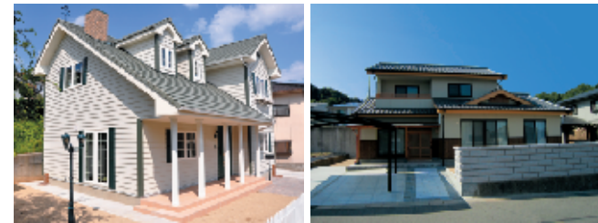
カントリー調にも平瓦は好相性

【瓦】新築住宅で使用するものとして、スッキリとした外観に仕上がる「平瓦」、エレガントな雰囲気を演出する洋風「S形」、落ち着いた佇まいの「J形（和形）」に大別できます。好みの外観テイストに合わせて選べ、瓦の凹凸を活かしたり、異なる色の瓦を混ぜて屋根全体を魅せることもできます。様々な形の瓦がありますが、どれも製造工程で高温で焼き上げるため、将来にわたって塗装のメンテナンスがいらぬのが最大のメリットです。瓦表面の塗膜の有無などによって、釉薬瓦、素焼き瓦、いびし瓦に分類されます。他の安い屋根材との価格差は1回の塗装費用より小さく、釉薬瓦は葺き替えも不要なため、長い目で見ると実はトータルコストが一番安い屋根材です。