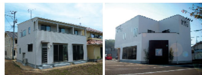
シンプルな低勾配片流れ

【ガルバリウム鋼板】亜鉛・アルミ合金でメッキした鋼板（鉄板）です。亜鉛メッキの「トタン」より対候性に優れています。建物全体のコストダウンにもつながるため、雨漏りの心配が少ない「瓦葺き」や「縦八葺き」で、低勾配で施工することが一般的です。屋根材として金属の「熱しやすく冷めやすい」特性が活き、日中屋根に蓄えられた太陽熱を素早く放熱してくれます。おかげで、室内へ熱が入りにくく、冷房効率のアップにつながります。高反射率のシルバー色で仕上げると、その効果は一段と高まります。建物全体をスタイリッシュに仕上げるため、屋根を隠す場合にも低勾配の片流れ屋根＝ガルバリウム鋼板を使用します。低勾配屋根に仕上げることで、建物高さを低く抑えることができ、意匠性を損なうことなく建物本体のコストダウンも可能です。