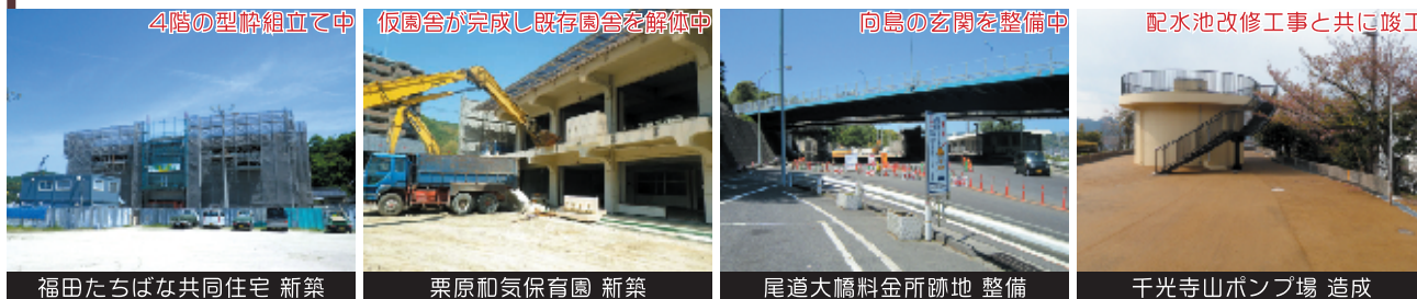
4階の型枠組立て中

住宅の新築とリフォーム以外にも、建築・土木工事を施工しています。 あらゆる現場で高い技術力を発揮します。