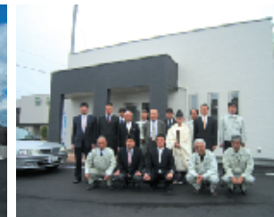
4月30日 開所式後の記念撮影