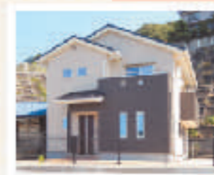
尾道市浦崎町 D様邸