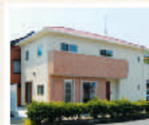
尾道市向島町 O様邸