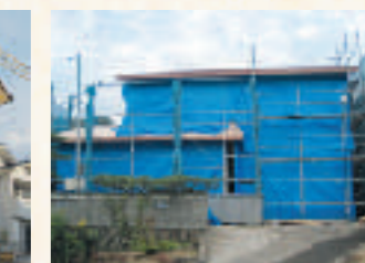
尾道市原田町 A様邸