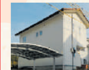
尾道市長江三丁目 S様邸