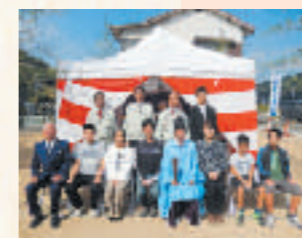
三原市明神四丁目 M様邸