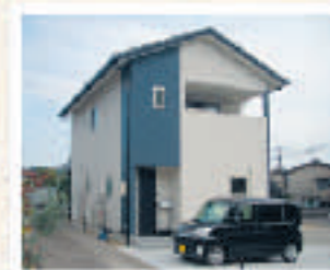
尾道市栗原町 Y様邸