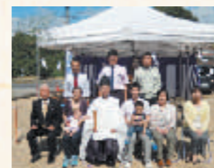
尾道市瀬戸田町 H様邸