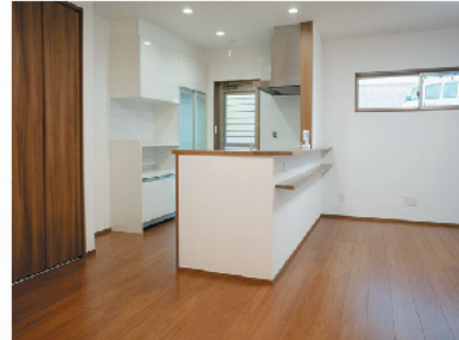
尾道市向島町 K様邸