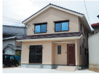
尾道市吉浦町 O様邸