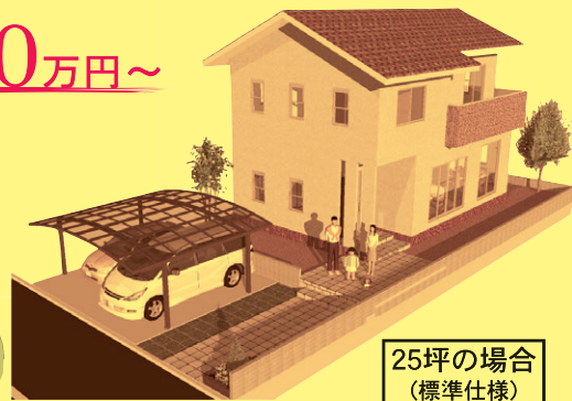
25坪の場合 (標準仕様)